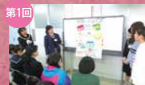
第1回 [カードメソッド] 目指す看護師像を語る

また、教えてもらう学習から自ら学ぶ学習へ、スムーズに移行できるように協同学習の授業を体験します。