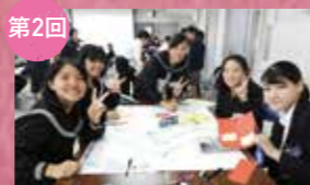
第2回 [協同学習] 看護師になるために如何に学ぶ