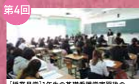
第4回 [授業見学] 1年生の基礎看護学実習後のケースレポート発表見学