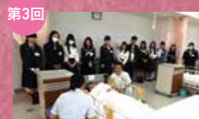
第3回 [授業見学] 卒業前シミュレーションの見学