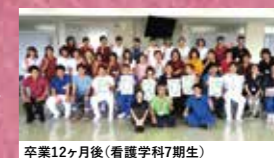
卒業12ヶ月後(看護学科7期生)

12カ月目は、一番身近な先輩として後輩の成長を支える役割を引き受ける自覚を持ちます。同時に臨床経験1年目の課題を仲間との交流の中で見つける機会としています。この体験を臨床に持ち帰り、新たな気持ちで看護実践に臨めます。