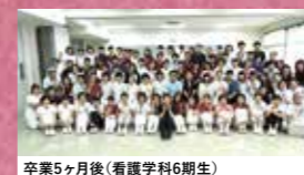
卒業5ヶ月後(看護学科6期生)

卒業後5ヶ月目に母校へ戻り、3年間共に過ごした仲間と「困っていること、学びたいこと、身につけたい技術」を確認することで、やればできる自己肯定感を高めることができるよう、里帰りトレーニングを行っています。